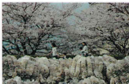
佳作 藤井 勉 (廿日市:地御前)