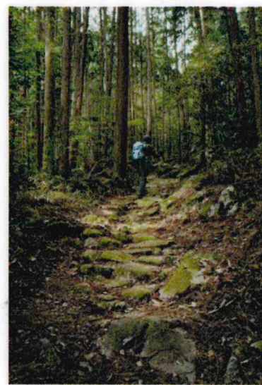
入選 向井畑 正治 (佐伯:津和野街道)