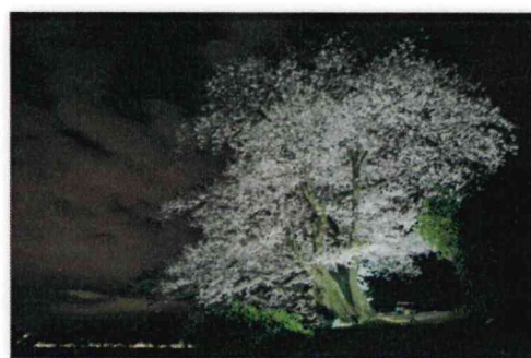
佳作 熊原 公明 (大野:鳴川)