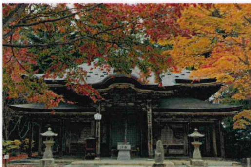
入選 新宅 誠 (廿日市:極楽寺)