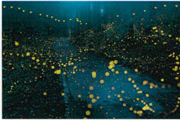
優秀賞 荒川 純一 (吉和:瀬戸の滝付近)