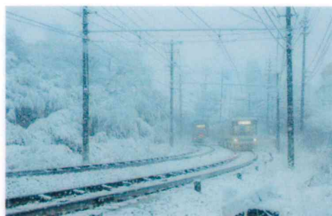
佳作 中谷 文生 (廿日市:地御前)