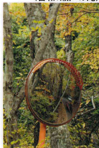
佳作 池浦 俊文 (吉和:もみのき森林公園付近)