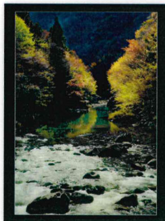
佳作 向井畑 正治 (吉和:小松原橋)