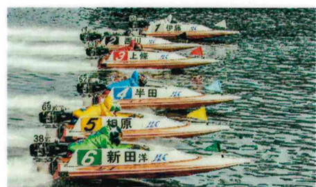
佳作 井上 良孝(大野:宮島口)