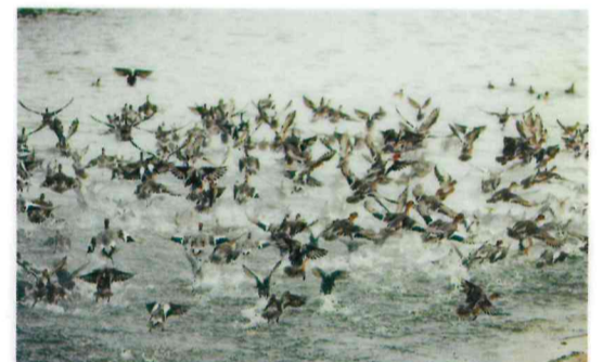
入選 八田 雅晴(廿日市:地御前)