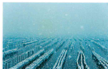
佳作 中谷 文生 (廿日市:扇園)