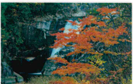
佳作 榎田 武司(佐伯:小瀬川本流)