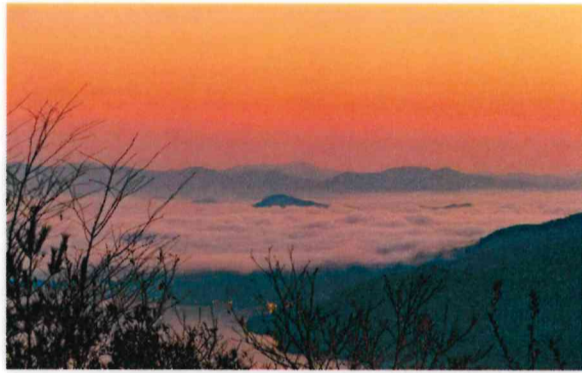
優秀賞 高山 浩二 (大野:経小屋山)