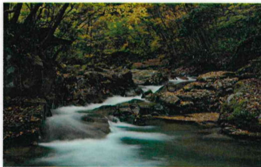
入選 廣森 均先(吉和:魅惑の里)