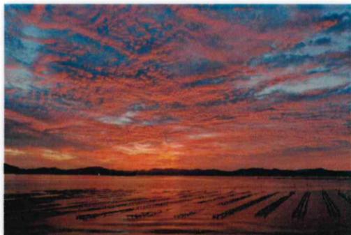
入選 三宅 保信 (廿日市:地御前)