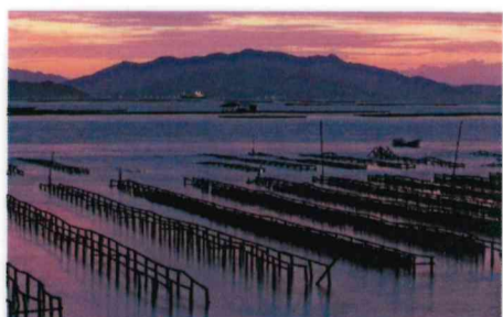
佳作 杉本 文夫 (廿日市:地御前)