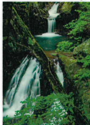
佳作 横山 泰明 (吉和:東山溪谷)