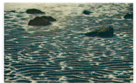
入選 門永 隆次 (廿日市市:地御前河口)