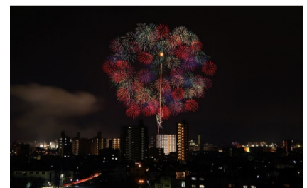
佳作 越山 浩則 (廿日市:JR廿日市駅付近)