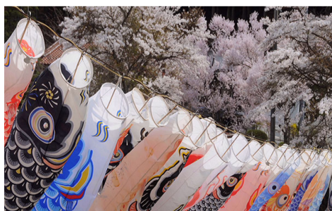
佳作 藤井 勉(吉和)