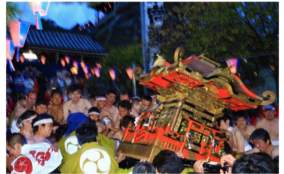
入選 出木谷 秀典(廿日市:天満宮)