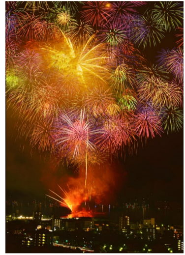
はつかいち観光協会賞(優秀賞) 向井畑 正治 (廿日市:宮島SA)