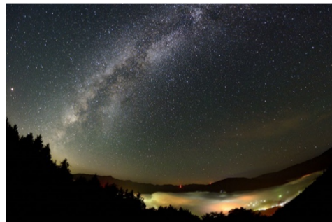
佳作 3タコ写真部(吉和:吉和展望台)