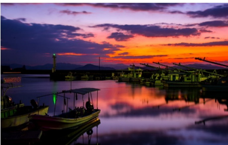
佳作 中谷 文生(廿日市:地御前)