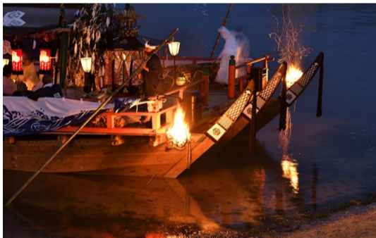
入選 廣森 均先(廿日市:地御前)