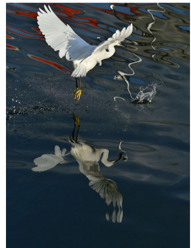
入選 三宅 保信 (廿日市:地御前)