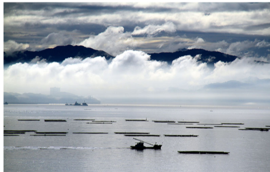
入選 西谷 正子(廿日市:阿品)